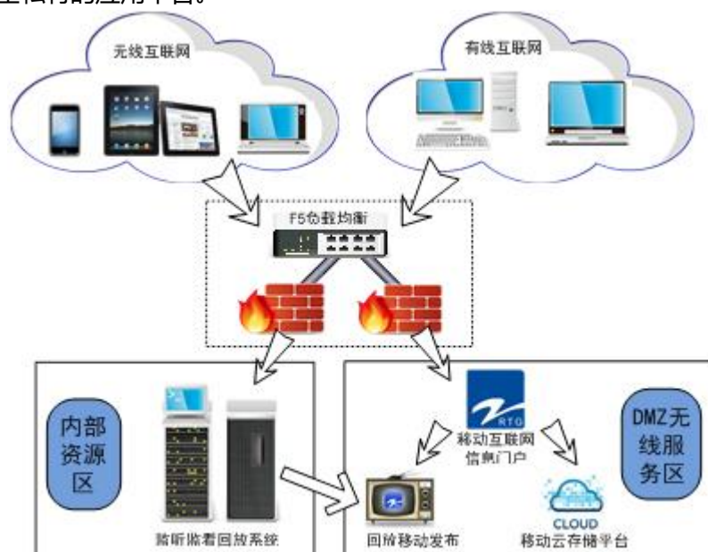
图 1：浙江广电移动应用平台网络拓扑图

在对业内先进的云计算解决方案和产品进行充分调研之后，浙江广电信息中心为移动应用平台确定了“安全第一、应用主导、利旧整合”的建设总纲。如图 1 所示，该项目将充分利用集团现有的软硬件资源，以移动互联网信息门户为统一入口，实现具有集团特色的、移动便捷的、安全私有的应用平台。