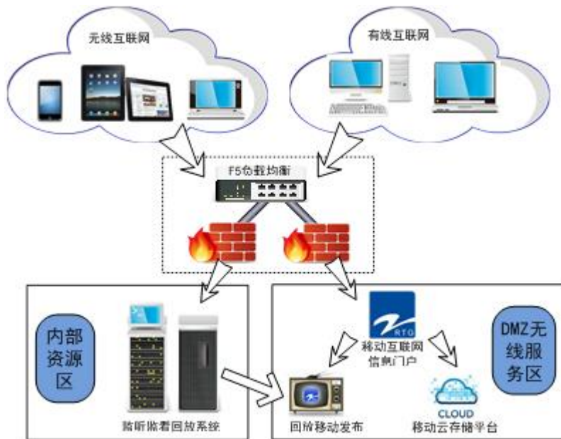
图 1：浙江广电移动应用平台网络拓扑图