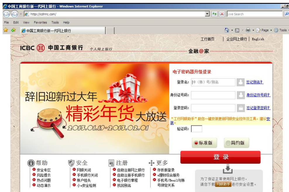
【钓鱼网站域名与官方网站相似，并谎称“密码器”需升级以获取用户密码】

当用户点击这些钓鱼网站并试图访问网上银行时，网站会弹出和官方网站相似的登陆框。一旦用户输入账号、密码、身份证号并点击登录，这些机密信息就会被不法分子偷偷上传到指定的服务器。而且，不法分子还会谎称用户需要升级密码器，以诱导用户输入密码器中的密码来进行“验证”。实际上，这个“密码器”内嵌恶意代码，用户输入的密码会被不法分子直接获取。