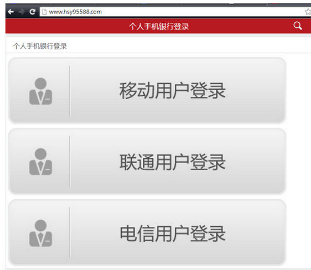
【假冒手机银行的钓鱼网站】

用户还需要谨记防范钓鱼网站的识别法则，即官方网站域名+浏览器+搜索引擎+第三方软件验证，钓鱼网站很难同时满足以上几种验证。趋势科技还建议用户安装 PC-cillin2014 云安全版等安全、高效的信息安全软件，PC-cillin2014 云安全版后台中具有全球钓鱼网站监控体系，以及爬网系统、网页安全分级功能等最新的防控技术，能全面监测和甄别网页中的恶意代码，并通过“主动式云端拦截技术”提前一步甄别出恶意网站及链接，帮助用户防范钓鱼网站威胁，安心享受春节假期。