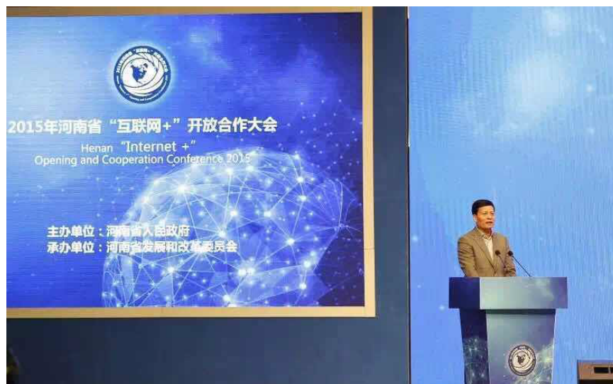
2015年河南省“互联网+”开放合作大会隆重召开

随着政府的高度重视，伴随着云计算、大数据应用的大规模普及，网络安全成为互联网+时代不可忽略的话题。就在11月18日举办的河南省互联网+开放合作大会上，亚信安全与新乡国家高新技术产业开发区签订了亚信新乡信息安全服务中心战略合作意向书。双方将就信息安全合作建立长期战略合作关系，共同成立亚信新乡信息安全服务中心，联手打造信息安全服务新模式。